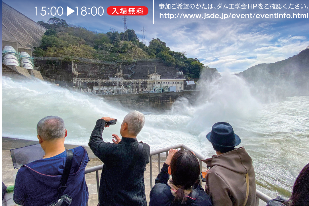
「特別なステージ」 鶴田ダム (鹿児島県) : 2025 九州ダムフォトコンテスト最優秀賞