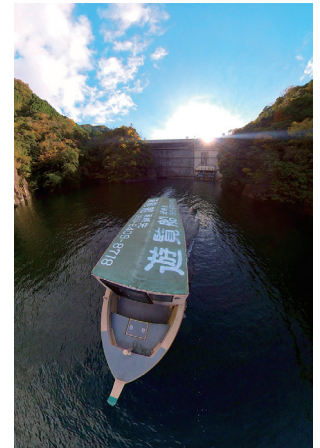
「遠ざかる陽光」 下笠ダム (大分県日田市)